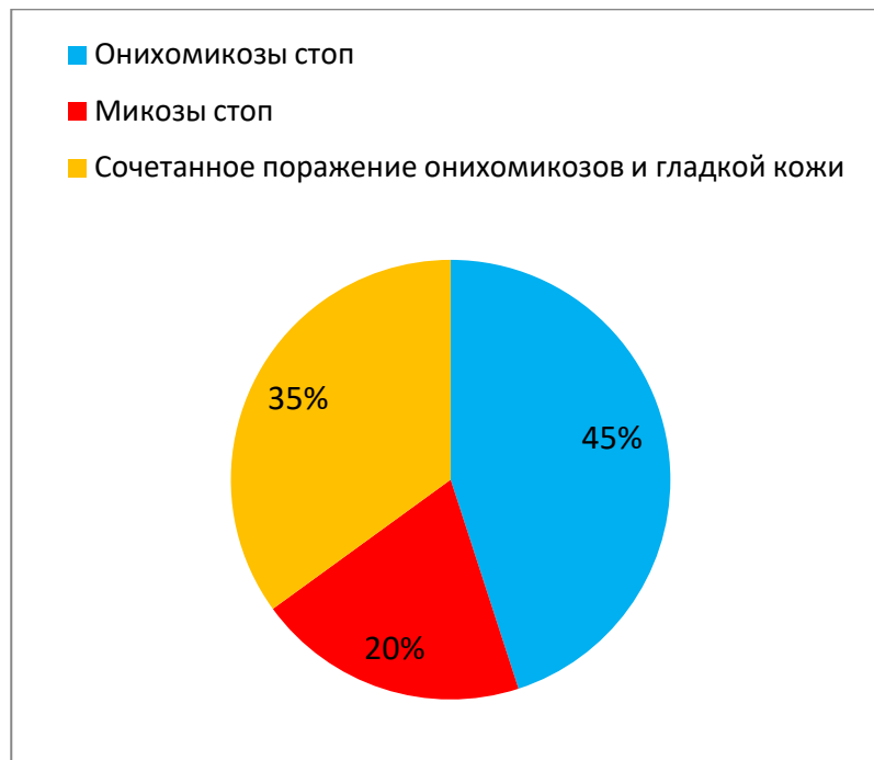
Рис. 2. Структура микотических поражений у работников сельскохозяйственного производства

Как видно из представленных данных, онихомикозы стоп являлись наиболее частой нозологией микотического характера у обследованных. Микозы стоп встречались у каждого третьего, сочетанное поражение онихомикозов и гладкой кожи - у каждого пятого больного.